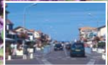
Lacanau au présent