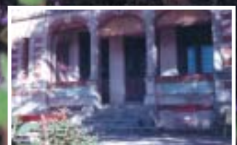
D'un siècle à l'autre