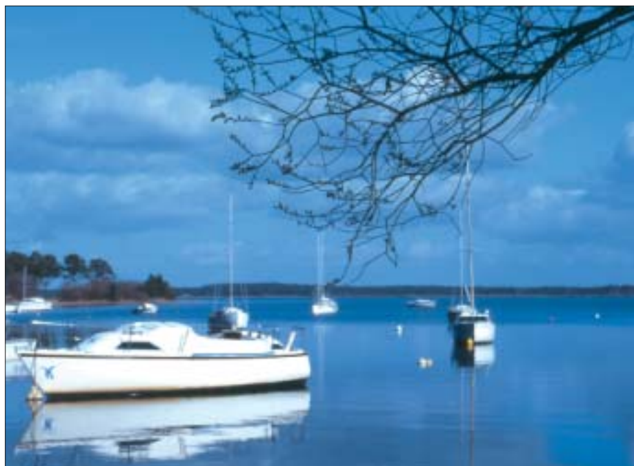
Une vue exceptionnelle à protéger

Derrière le prétexte invoqué à savoir l'implantation d'une maison de retraite et l'aménagement d'un pavillon Altzei-