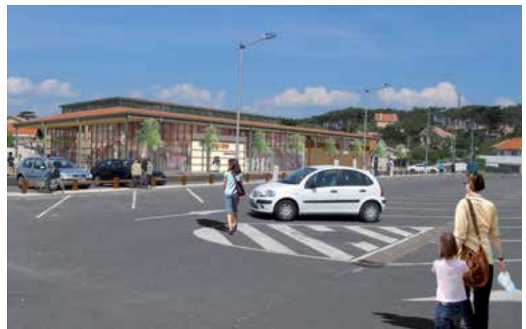
Le futur « U Express » et la pharmacie seront cote à cote