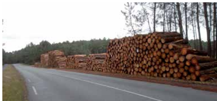
Coupes rases et débroussaillage (prévention des risques d'incendie), Lacanau-Océan bien propre pour démarrer la belle saison, ça fait plaisir !