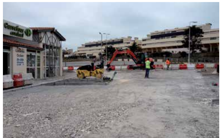
Le parking de Carrefour Market se refait une beauté