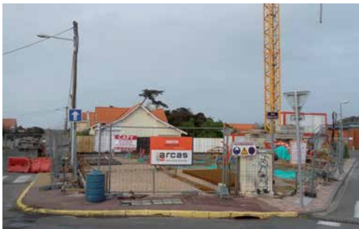
Rond point Thiers : de nouveaux logements et commerces

Les 2 incompréhensibles projets immobiliers en front de mer vont (quand même) voir le jour.... futurs candidats à la « relocalisation des biens et des personnes » prévue dans les études du GIP littoral !