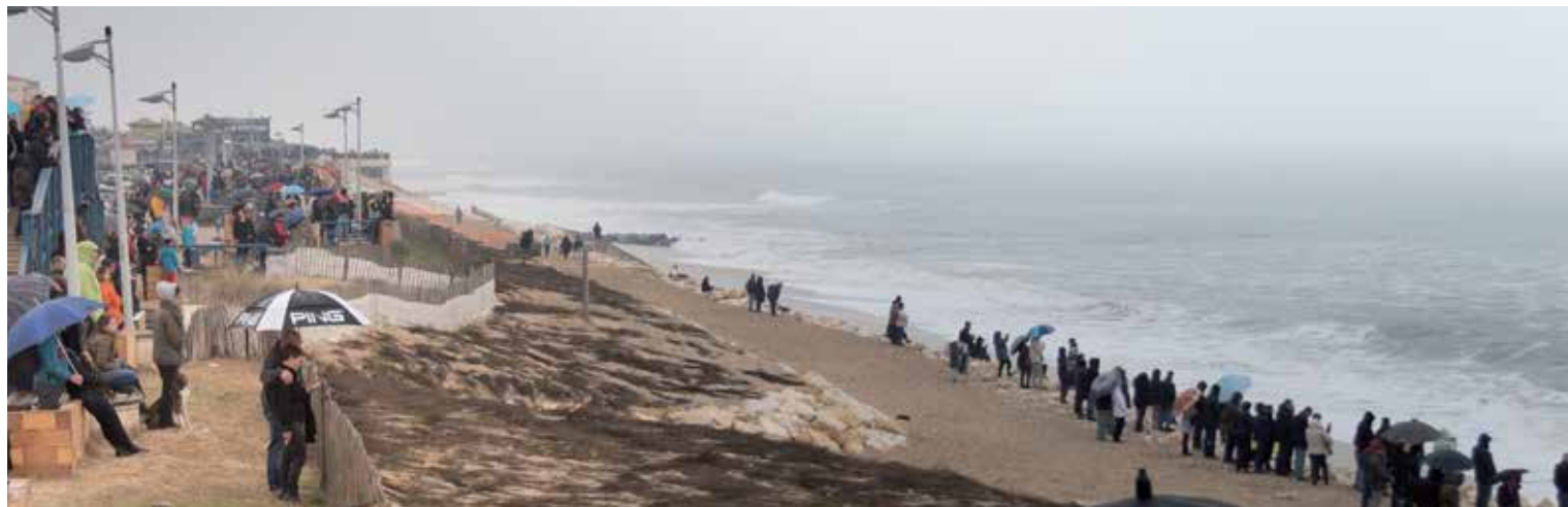
La grande marée du 21 mars 2015 " coef 119"

Pour postuler au Conseil d'Administration, merci d'envoyer un courrier de candidature à la Présidente, par courrier ou par mail si possible pour le 18 AVRIL.