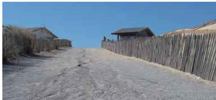
L'accès plage Sud : la grave, déjà ravinée, a remplacé les caillebotis amovibles pour monter la dune . Durable ?