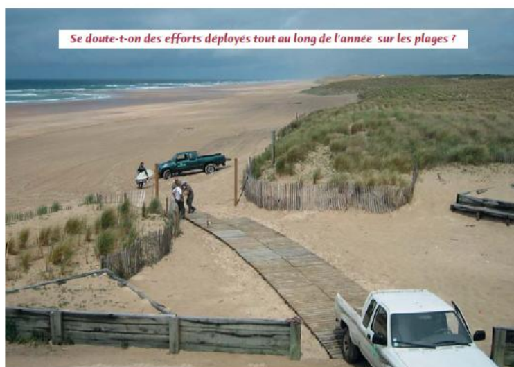
Se doute-t-on des efforts déployés tout au long de l'année sur les plages ?

vaux dunaires (pose de filets, couverture de genêts...) et la propreté du site. Ils sont assurés sous la maîtrise d'ouvrage de la Commune et l'enveloppe se monte à 76.200 euros HT. La commune bénéficie d'une subvention du Conseil Général de 17.860 euros pour les deux plans plages nord et sud.