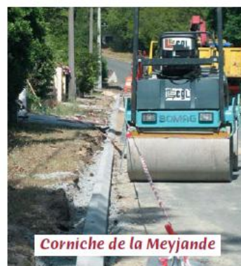
Corniche de la Meyjande

La Commune vient de recevoir à nouveau 18.414,73 euros du FIPOL, suite au naufrage du Prestige, soit au total 30% du montant estimé du préjudice.