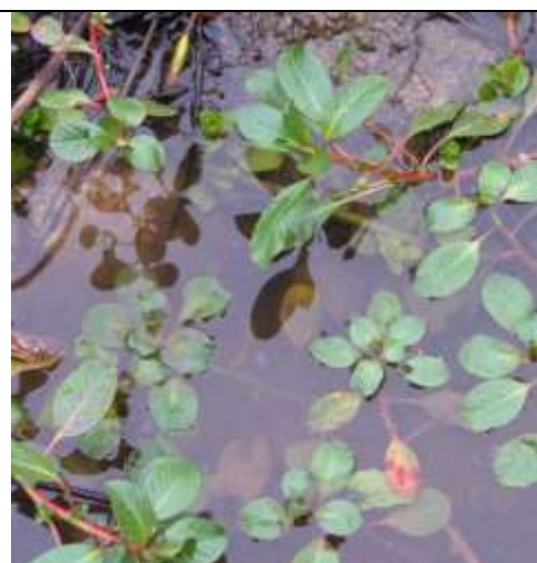
Jussies au printemps

A Lacanau on trouve principalement des jussies autour des anses de Carreyre et de Longarisse.