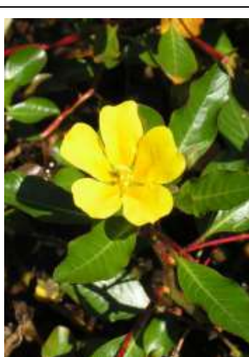
Jussie en été

Des campagnes d'arrachage ont permis de les empêcher de transformer le bord de ces anses en prairies ponctuées de fleurs jaunes. La campagne 2018, organisée par l'association des riverains du lac de Lacanau avec l'aide du SIAEBVELG, le syndicat intercommunal de gestion des eaux, a permis de nettoyer les secteurs où