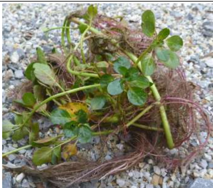
Ce que l'on arrache

Après avoir écouté les explications utiles (1/2 heure), nous nous répartirons en équipes de trois à cinq personnes qui se dirigeront vers les anses de Carreyre et Longarisse, pour arracher des jussies jusque vers 12h30 et les mettre en tas sur la berge à des emplacements balisés où elles seront ramassées par les services du SIAEBVELG et de la commune.