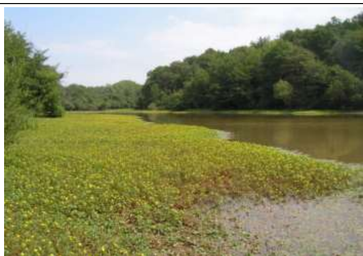
Ce qui finit par se produire en l'absence d'arrachage

Présentes depuis une vingtaine d'années, les jussies sont une des plantes exotiques qui envahissent le lac de Lacanau. Elles forment des herbiers très denses le long des berges ensoleillées et un peu envasées. Leur développement ne peut être combattu que par arrachage manuel. Heureusement celui-ci, relativement aisé, est très efficace à condition d'être pratiqué avant que les herbiers de jussies soient devenus denses : au bout de quelques années, les quantités à évacuer deviennent énormes.